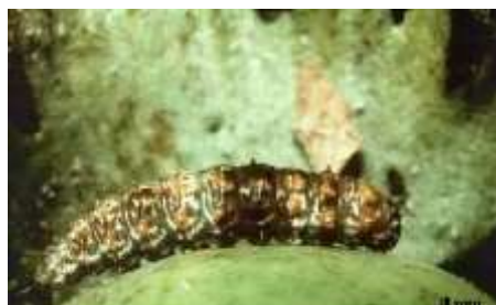
Rough bollworm larva.