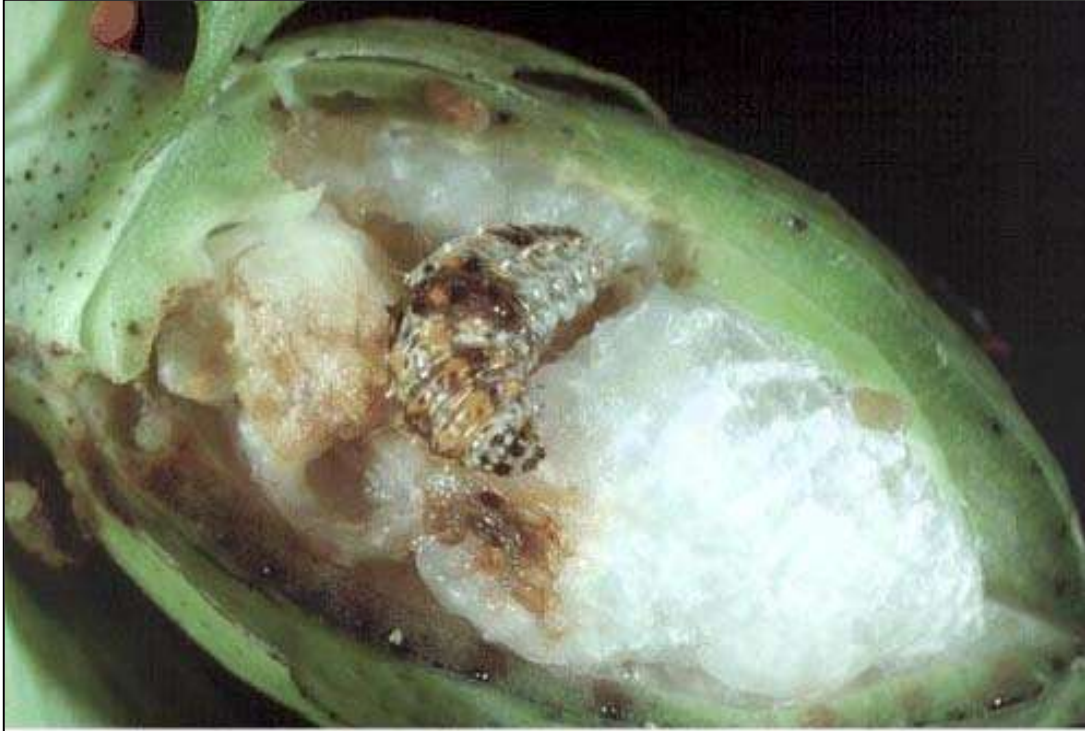
Rough bollworm larvae in damaged boll