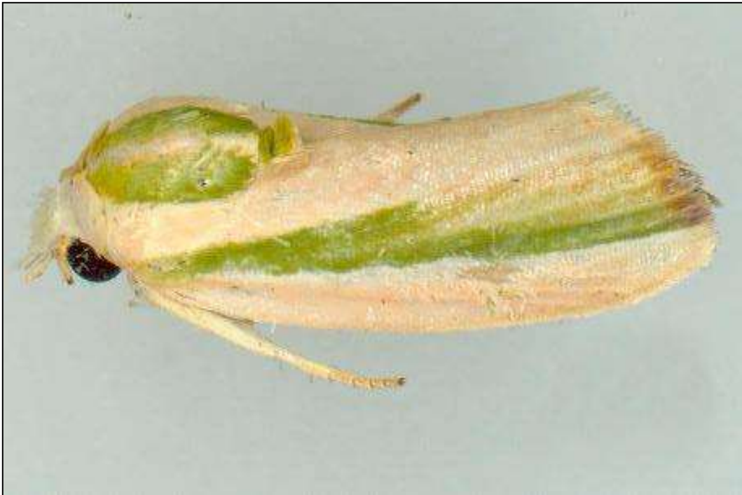
حشرات کامل آفت کرم خاردار قوزه پنبه