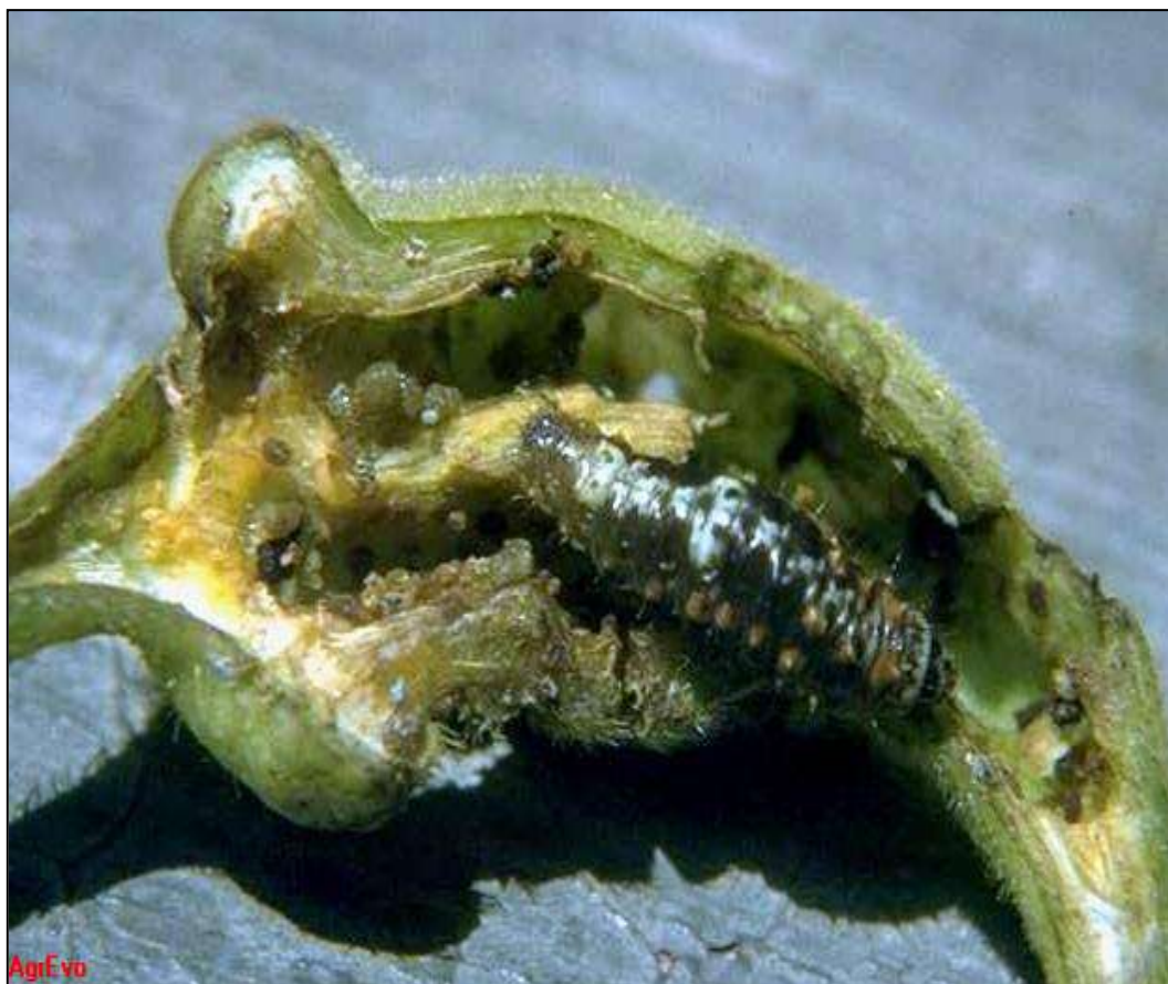
علائم خسارت آفت کرم خاردار قوزه پنبه

این آفت به گیاه میوه بامیه همانند پنبه خسارت می زند، خسارت آفت معمولاً بعد از گذشت سه هفته از کاشت محصول در مزارع قابل مشاهده است، در ابتدا از برگ و سرشاخه های انتهائی گیاه بامیه و سپس از جوانه، گل و میوه بامیه تغذیه می نماید و در نتیجه باعث کاهش کیفیت و افت محصول بامیه می گردند.