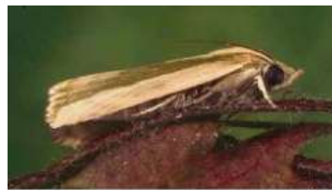
Rough bollworm adult.